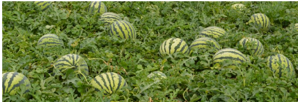
Homogeneidad de calibres en sandías tratadas con SPICY POKER®