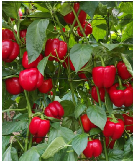
Pimiento california Ítaca tratado con SPICY POKER®. Uniformidad de tamaño y maduración.

También puede ser aplicado vía radicular entre 2-5 ml/L en los mismos momentos.