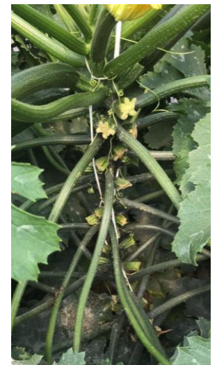
Calabacín con crecimiento equilibrado y gran número de cortes gracias a los tratamientos de SPICY POKER®